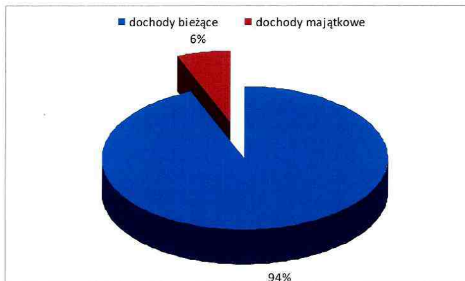
Rysunek Nr 1 Dochody ogółem z podziałem na dochody bieżące i majątkowe

Do planowanych w budżecie powiatu dochodów majątkowych w kwocie 4 964 989 zł zaliczamy: