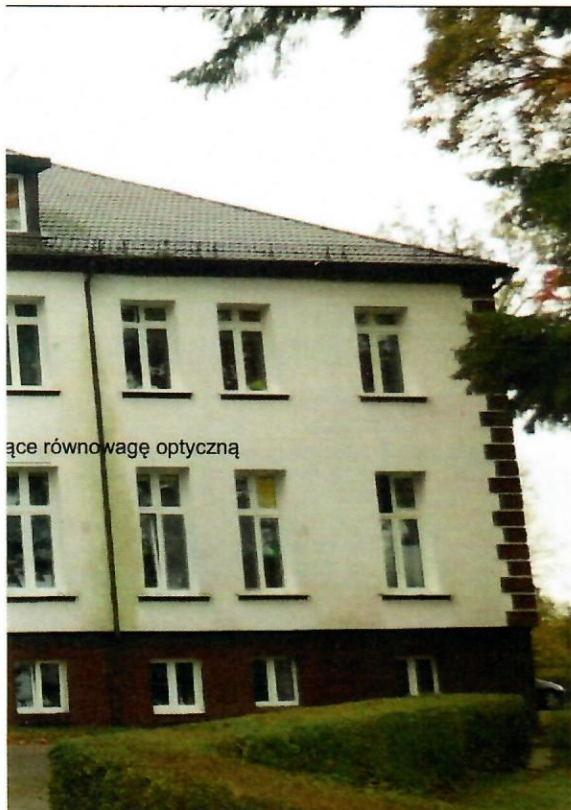
ące równowagę optyczną