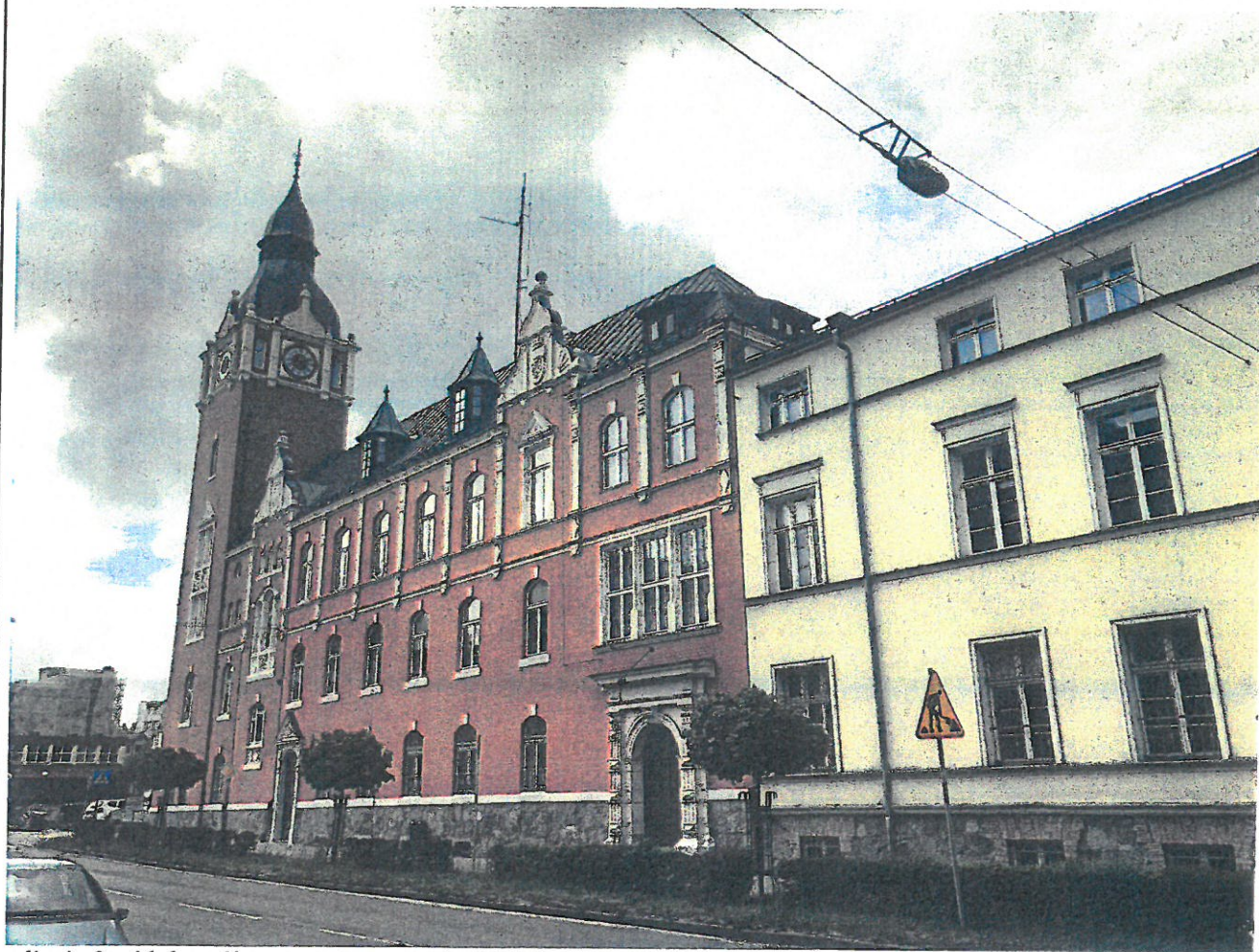
zdjęcie 3 widok ogólny rozpatrywanych obiektów

URZĄD MIEJSKI W SŁUPSKU Wydział Budownictwa