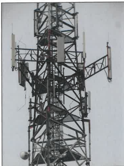
Rys. 3 Widok badanego obiektu