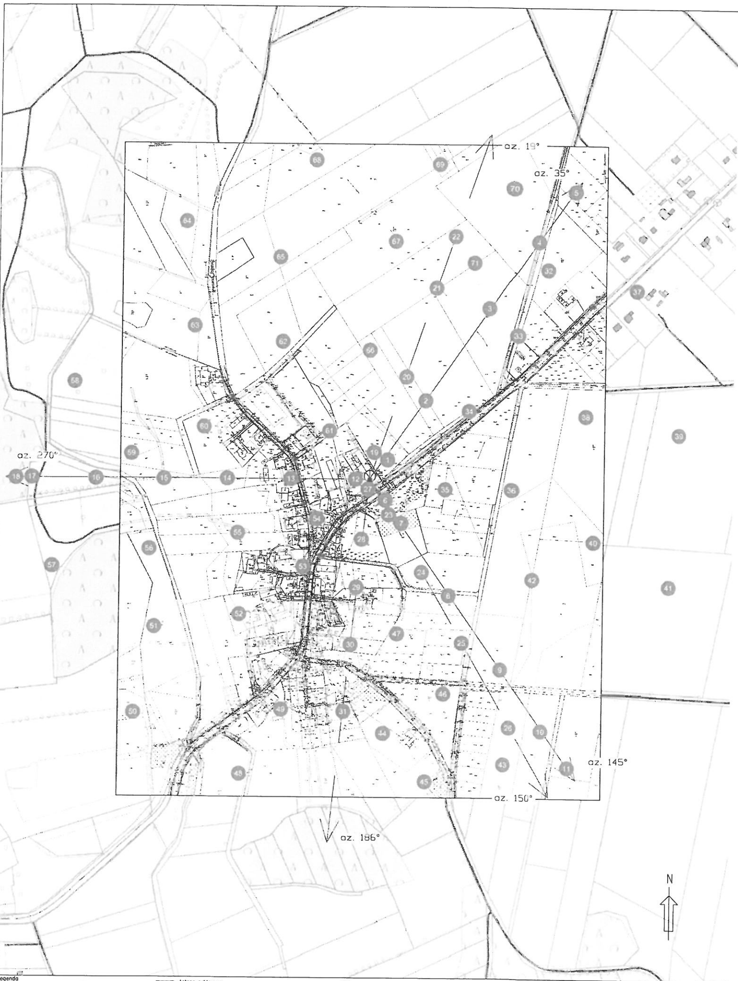
Rys.1 Lokalizacja pionów pomiarowych