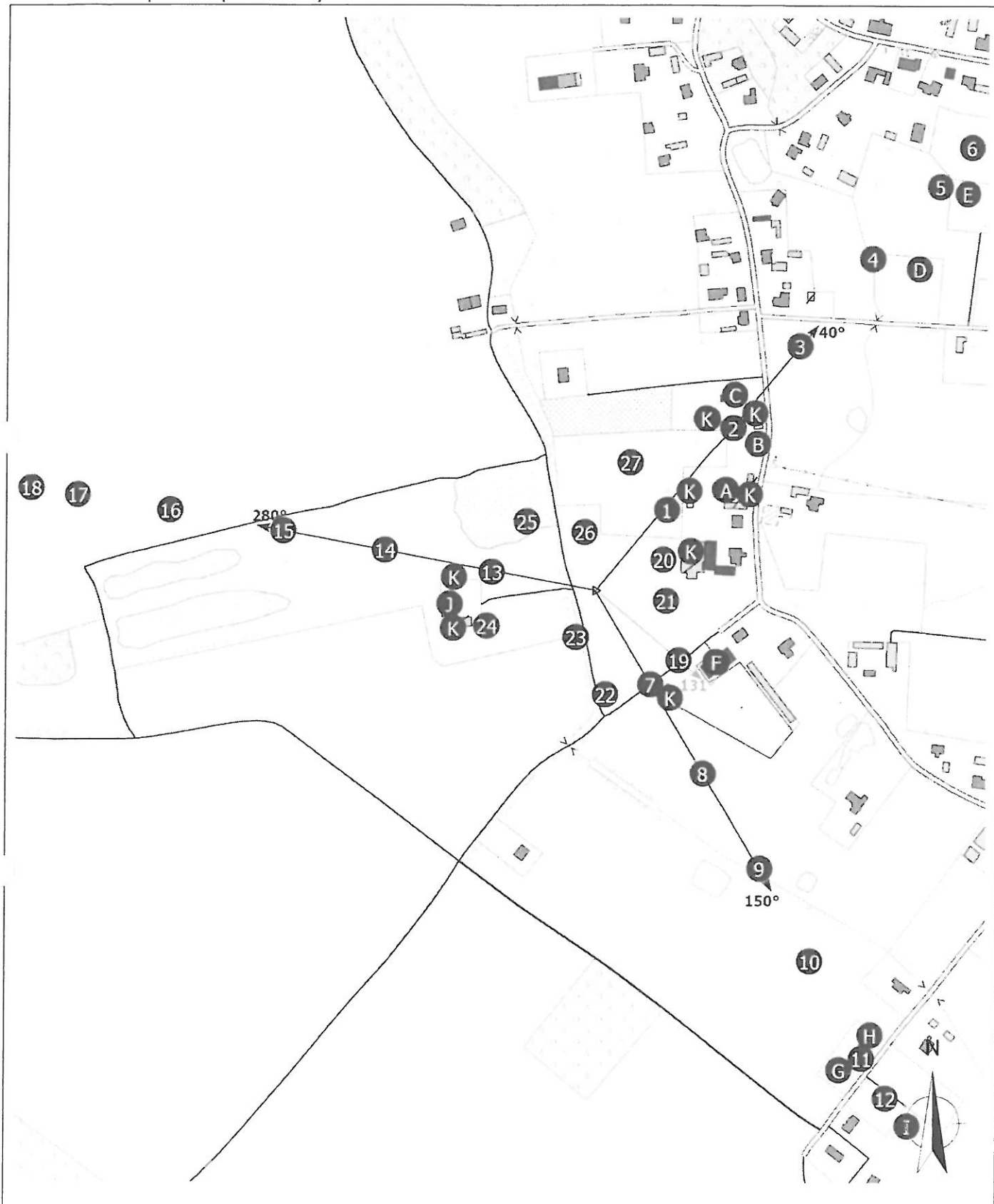
Załącznik 2. Widok pionów pomiarowych